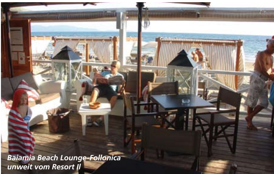
Baiamìa Beach Lounge-Follonica unweit vom Resort Il

Der 1999 gebaute Golfplatz ist ganzjährig bespielbar. Die angrenzende „Pelagone Golf Academy“ unterrichtet zielorientiert und ganzheitlich, individuell und der Persönlichkeit des Spielers, seinem Lerntyp und seinen Fähigkeiten angepasst. Es werden besondere Angebote zur Platzreife während des Urlaubs gemacht. Toll die Idee: Golf-