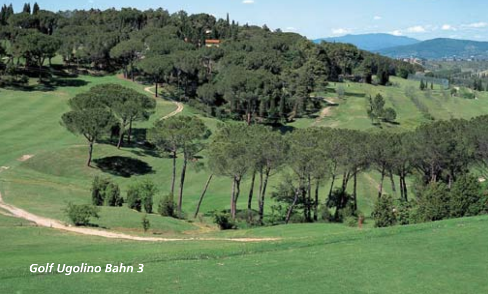
Golf Ugolino Bahn 3