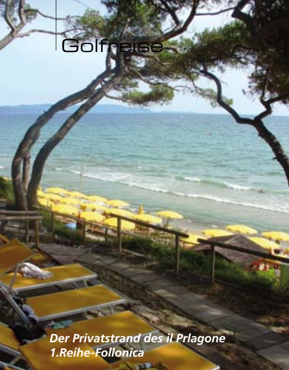
Der Privatstrand des il Prlagone 1.Reihe-Follonica