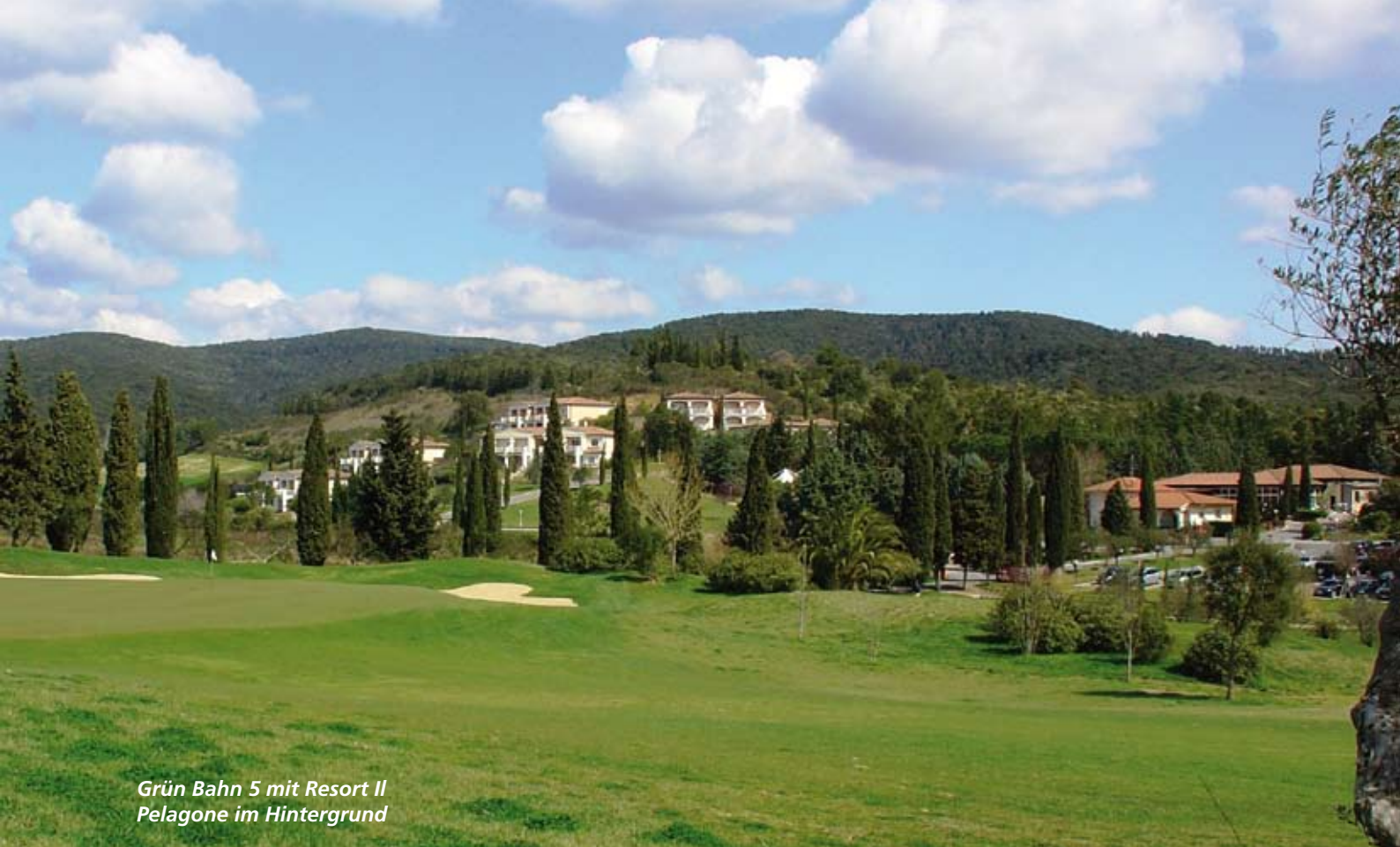
Grün Bahn 5 mit Resort Il Pelagone im Hintergrund

kurs für die Familie. Der hoteleigene Golf Club zählt zu den Top-Anlagen in Italien. Inmitten silberner Olivenbäume und endloser Reihen von Zypressen entwarf Keith Preston einen anspruchsvollen Golfplatz, der sich perfekt in die Landschaft einfügt. Die 18-Loch-Golfanlage mit internationalem Standard, Golfschule, großzügiger Driving Range mit 7 überdachten Abschlägen und zwei Putting-Greens bietet sowohl Profi-Golfern, als auch Einsteigern ideale Voraussetzungen.