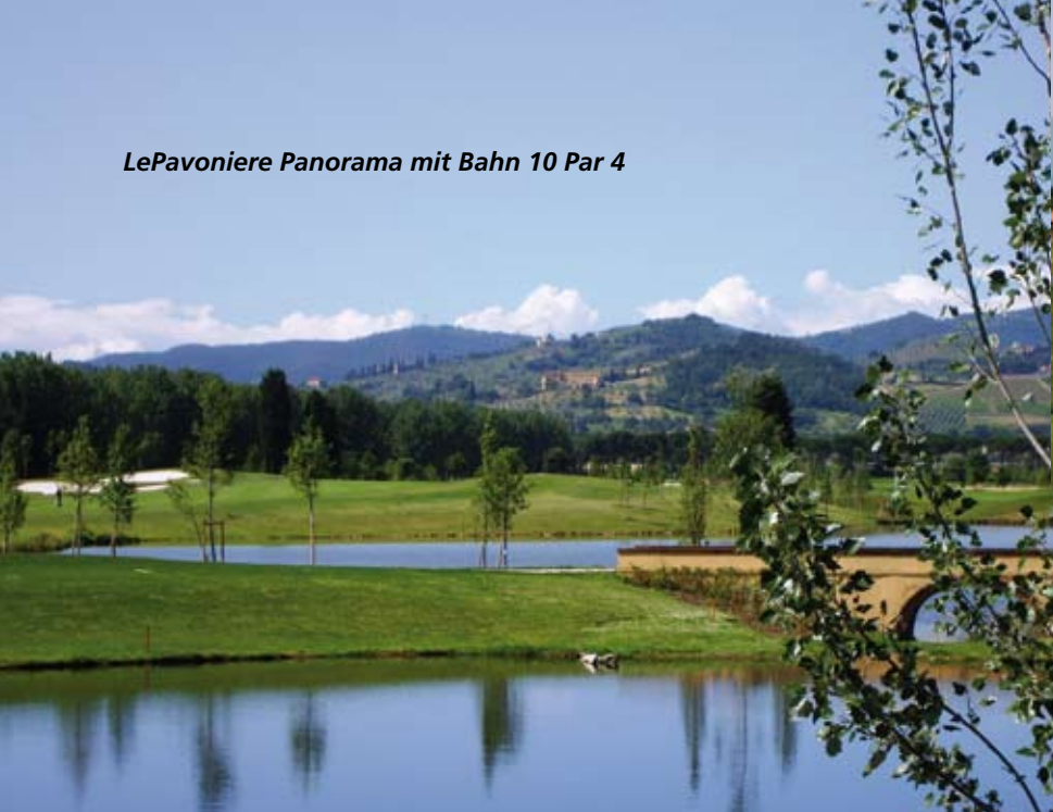
LePavoniere Abschlag18 mit Clubhaus

über die Panoramastraße zu erreichen. Unbedingt sollte man im Restaurant La Torre, Piazza San Giusti 8, (Tel. 0572 70650) einen Tisch zum Abendessen in Mitten dieses Örtchens buchen.