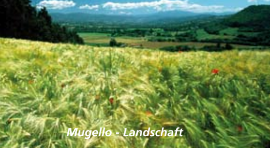
Mugello - Landschaft