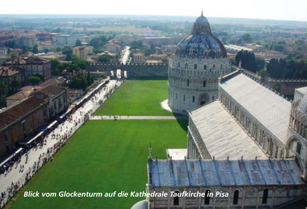
Blick vom Glockenturm auf die Kathedrale Taufkirche in Pisa