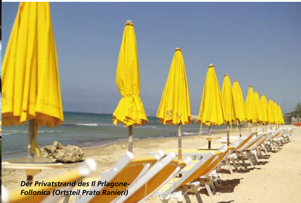
Der Privatstrand des Il Prlagone- Follonica (Ortsteil Prato Ranieri)

Golf Residence il Pelagone liegt nicht sehr weit von weltberühmten Kulturstädten wie Rom, Pisa, Siena und Florenz. In der näheren Umgebung finden sich lohnenswerte Ausflugsziele wie kleine Bergdörfer und zauberhafte Stranddörfer.