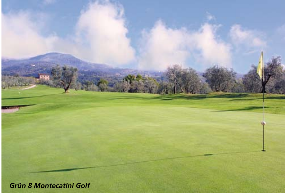
Grün 8 Montecatini Golf

Um den oberen Teil der Toskana zu erforschen ist das Pievaccia Resort/Golfhotel Montecatini der ideale Ausgangspunkt. Der