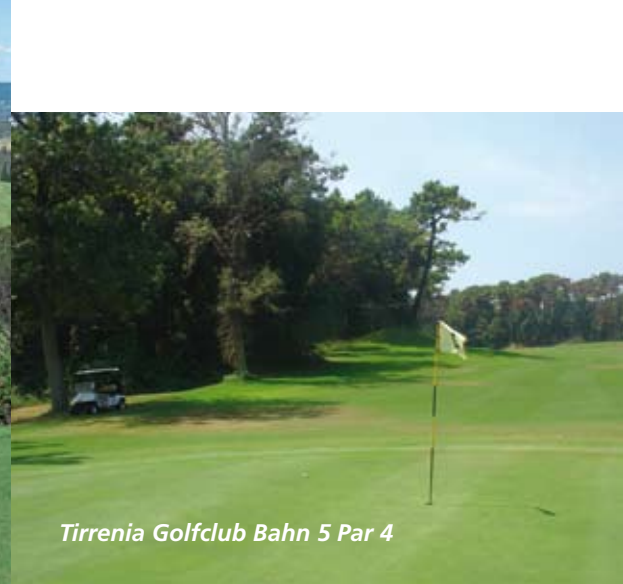
Tirrenia Golfclub Bahn 5 Par 4

platz ist mit der älteste in der knapp über 100-jährigen Geschichte des italienischen Golfsports. Er wurde von der englischen Kolonie der angrenzenden Stadt Florenz gegründet. Wundern Sie sich nicht, wenn Sie den einen oder anderen bekannten Star dort treffen. Die Bahnen auf den Hügeln des Chiantigebietes haben viele Schräglagen und extreme Abhänge. Immer wieder geht es hoch und runter. Zwischen Zypressen und Olivenhainen blickt man rundherum auf die traumhafte und weltberühmte Landschaft von Florenz. Die ersten neun Loch erfordern, durch die vielen „natürlichen Hindernisse“, die größte Konzentration. Aber „ausruhen“ kann man auch bei den „2. Neun“ nicht wirklich. Wer bei diesem Platz überlegt spielt, lieber etwas kürzer aber dafür präzise schlägt, wird ein gutes Ergebnis und einen tollen Golftag haben. Auch hier ist, wie in vielen Clubs in Italien, ein Pool zum Relaxen vorhanden. Das Green-Fee beträgt 80,- € und wochenends 95,-€. Ein Golfcart ist hier sehr empfehlenswert.