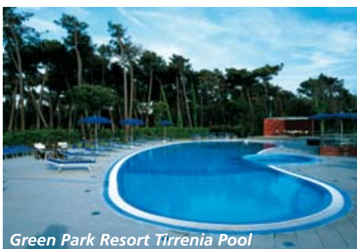
Green Park Resort Tirrenia Pool

Der 9-Loch Parcours, der vom englischen Architekten Ken Cotton geplant wurde und mit wahrer Professionalität vor 40 Jahren verwirklicht wurde, schlängelt sich durch einen jahrhundertealten Wald. Er liegt mitten im Naturpark von San Rossore. Man genießt die absolute Ruhe, das Vogelgezwitscher, den Duft der Pinien und des nahen Meeres. Kaum zu glauben, dass man ganz nahe der bekanntesten Beaches von Pisa golft! Unweit der „Vip-Places“ wie „Viareggio“ mit seinem Yachthafen und „Forte dei Marmi“. Im Vergleich zu dem Nachbarplatz Cosmo-