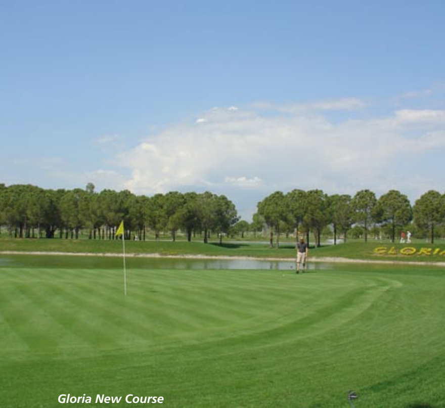
Gloria New Course