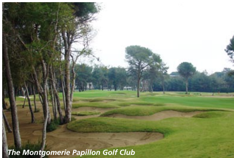
The Montgomerie Papillon Golf Club

Aber nun zum Platz: Es sei vorweggenommen, dass „Colin Montgomerie“ sicherlich nicht an Amateure dachte, als er den Platz designed hat. Allerdings hatte man dann of-