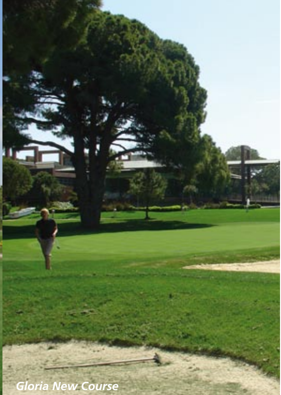
Gloria New Course