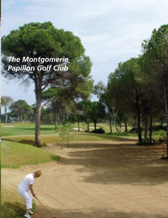
The Montgomerie Papillon Golf Club