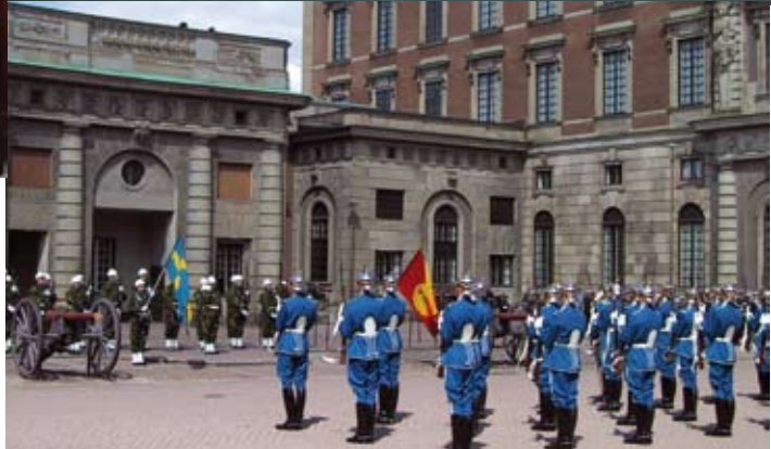
Bild oben links: Stockholmer Altstadt Bild oben rechts: Phantastischer Blick vom Turm der Stadthalle über Stockholm. Bild unten rechts: Gardewechsel vor dem Königsschloss.