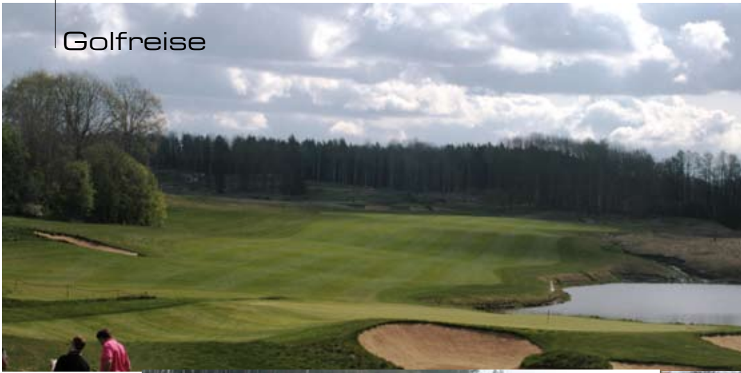
Bild oben links: Golfclub Vidbynäs Bild unten links: Golfclub Vidbynäs Forest Bahn Loch 12 Bild unten rechts: Jens Dagné mit Keith Karlson