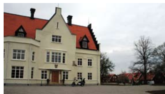
Vidbynäs Schloss und Ferienhäuser

Wenig bekannt ist, dass die Gegend um Stockholm durchaus viel für das „Golferherz“ zu bieten hat. Fahren Sie nur 45 km südlich auf der E4 in Richtung Södertälje, dann wechseln Sie auf die E20 Richtung Göteborg. Verlassen danach bei Nykvarn die Autobahn und biegen nach links, am Ende der Straße. Wenn Sie links die Kirche sehen, biegen Sie rechts in die Allee und vor Ihnen liegt „Schloss Vidbynäs“ mit seinem gleichnamigen Golf-Resort. Das Schloss liegt an einem kleinen See und ist genial für Tagungen oder Events der unterschiedlichsten Art geeignet. Sowohl die super renovierten, alten Räume als auch der neue Anbau mit Restaurant sind mit allem ausgestattet was das „Veranstaltungsherz“ begehrt. Gleich neben dem Schloss gibt es süße, rote Schwedenhäuser der unterschiedlichsten Größe für die Tagungs- oder Golf Gäste. Dem nicht genug schließen sich bis zum Golfplatz