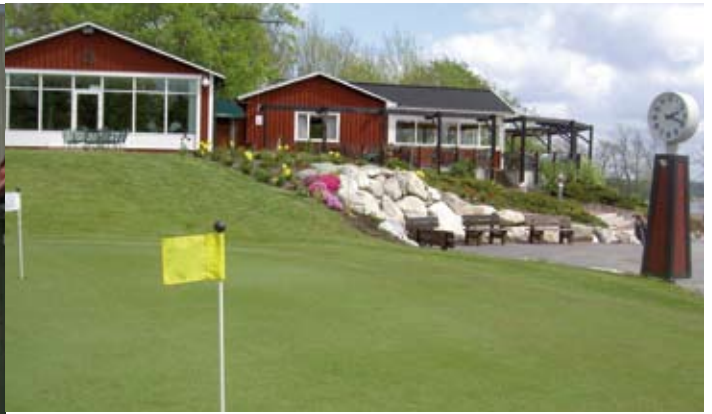
Bild links: Sigtuna, die älteste Stadt Schwedens. Bild rechts: Golfclub Sigtuna.